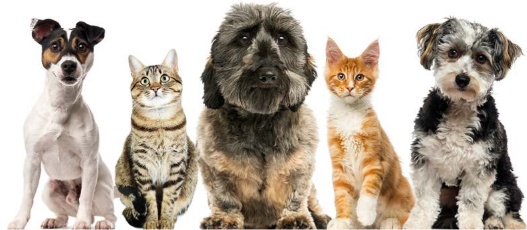
Varje instrument har en ansvarig servicetekniker. Det innebär att du får direktkontakt med en expert.

Triolab strävar efter att erbjuda högsta kvalitet på produkter, utbildningar och service. Vi är certifierade enligt ISO 9001:2015 och ISO 14001:2015. Vårt mål är att alltid använda alternativ med låg miljö- och klimatpåverkan.